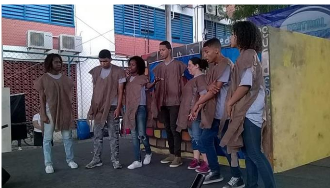
Apresentação na escola