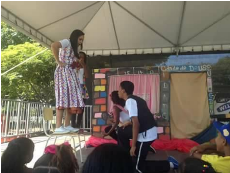
Apresentação na praça da Cidade de Deus